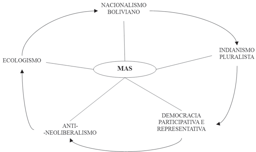
FIGURA 2 - DIMENSÕES DOS DISCURSOS DO MIP