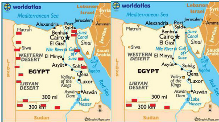
Mapa 2 – Evolução dos bolsões de segurança no Egito (fev./jun. 2012)