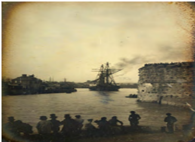
Figure 4: Navire quittant le port du Havre: [photographie] / Louis-Cyrus Macaire, 1851

Source: gallica.bnf.fr / Bibliothèque nationale de France.