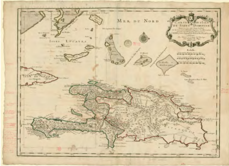
Figure 1: Carte de l'isle de Saint-Domingue... Delisle, Guillaume (1675-1726).

Source: gallica.bnf.fr / Bibliothèque nationale de France.