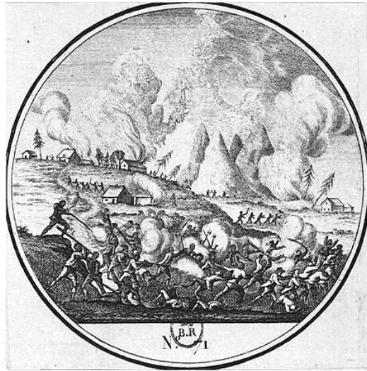
Figure 2: Révolte des Nègres à Saint-Domingue