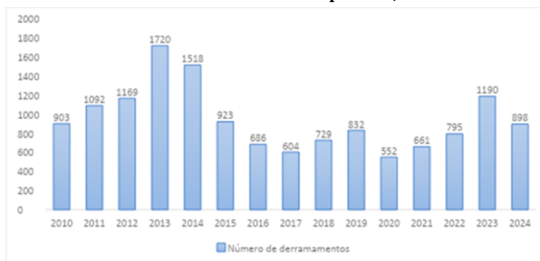
Gráfico 2 – Número de derramamentos por ano, 2010 a 2024