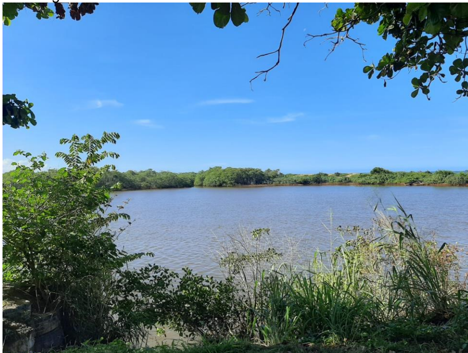
Fotografia 1. Rio Riacho e barra de areia da reserva de Comboios

da zona urbana da Barra do Riacho, colateral à linha costeira, sendo separado do mar por uma barra de areia vegetada (FERREIRA et al., 2021) (Fotografia 1).