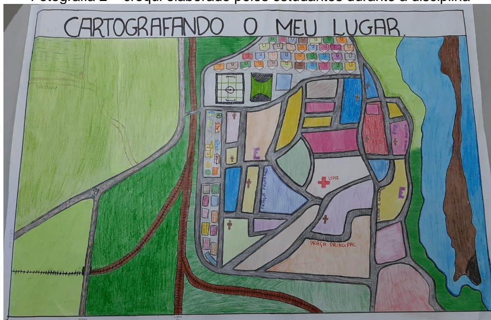
Fotografia 2 – croqui elaborado pelos estudantes durante a disciplina

A fotografia 2 abaixo apresenta um dos croquis que foram elaborados pelos estudantes durante a disciplina de eletiva.