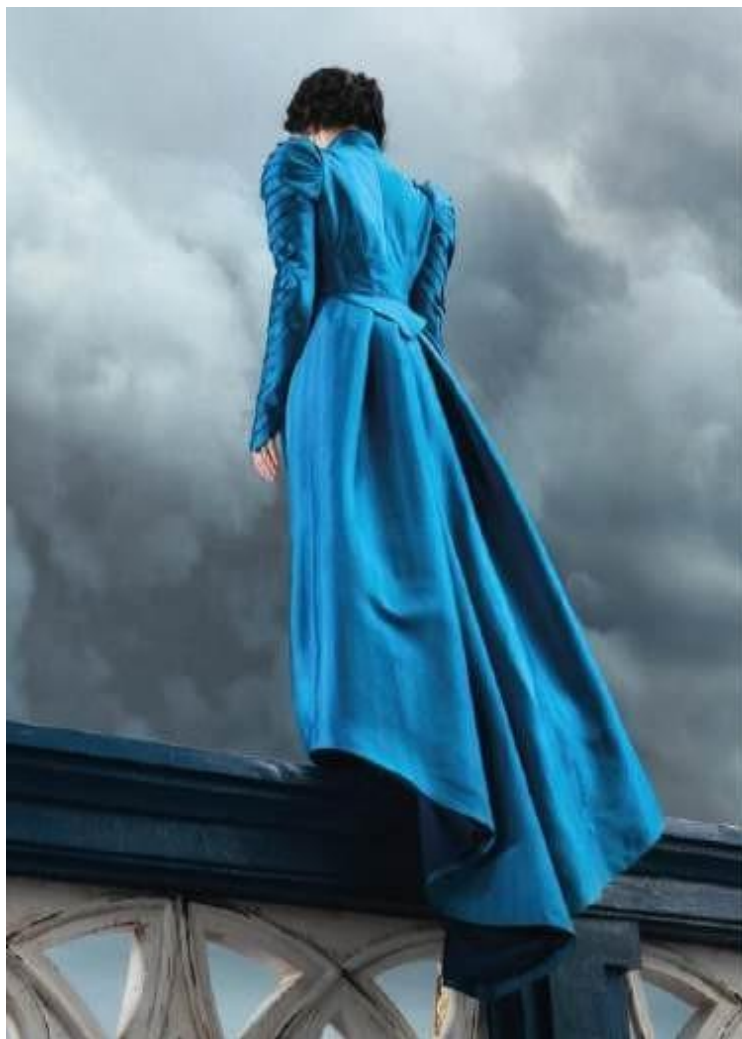
Fotografia 1- Emma Stone em Poor things

estabelece maneiras de atravessar o absurdo e desejar a vida. O filme Poor things inicia mostrando o ato do suicídio de uma mulher de vestido azul. Esse uso do vestido azul pode ser interpretado esteticamente como a depressão, a angústia e náusea desta personagem, visto que, a palavra azul no inglês é habitualmente usada para falar de uma tristeza profunda.