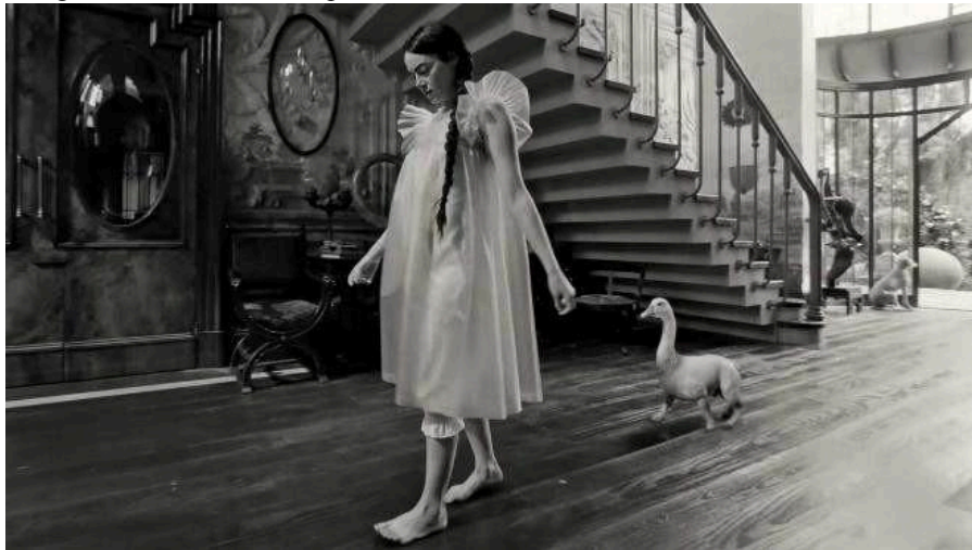
Fotografia 2- Bella Baxter aprendendo a caminhar

um experimento, não é nem a mulher suicida, nem a criança. Bella possui atos totalmente destituídos de moral social, não havendo espaços para a culpa de uma época (vitoriana) fortemente coibida sexualmente, principalmente para as mulheres. Além disso, ela tem dificuldade de fala e movimentação, porém esses aspectos progridem mais rapidamente por ter um corpo totalmente formado, logo seu cérebro tenta acompanhar o restante de sua constituição física.