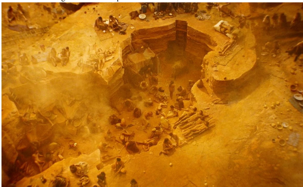
Fotografia 8- Revolta pelo sofrimento do outro: cenas de Alexandria