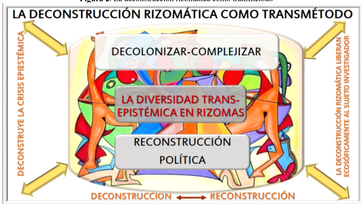
Figura 2. La deconstrucción rizomática como transmétodo