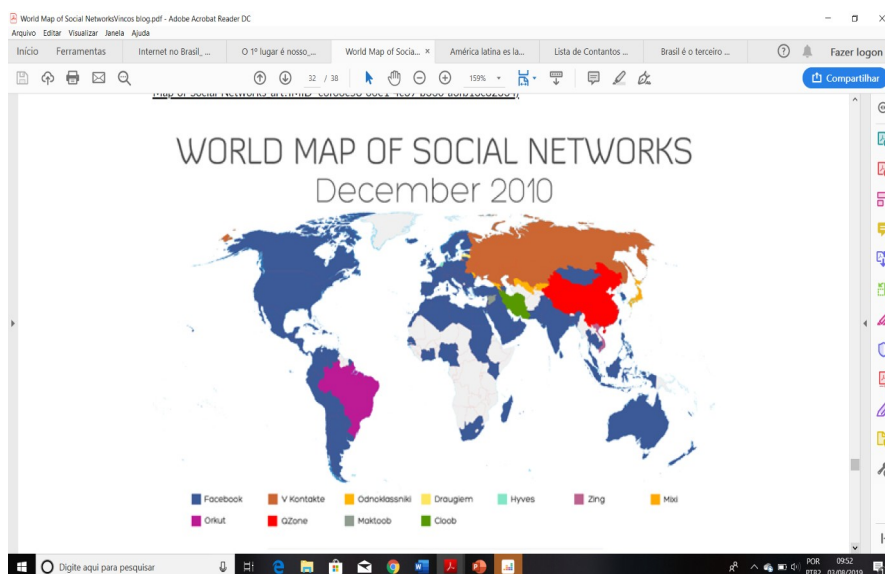
GRÁFICO 01 - Fonte: https://vincos.it/world-map-of-social-networks/ acesso em 24/07/2019