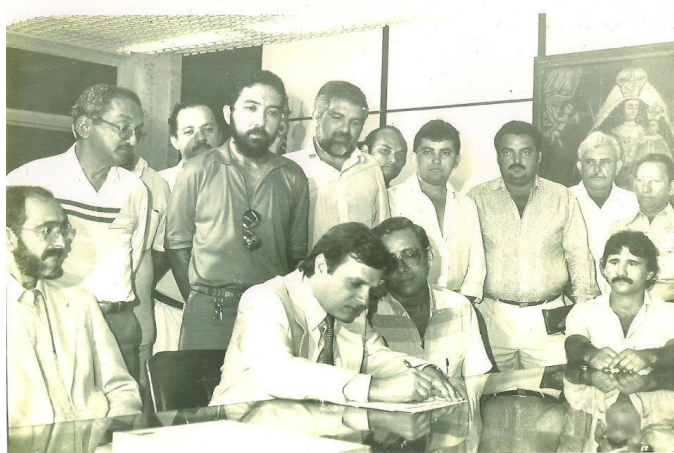
Figura 2 - Tasso Jereissati sancionando as leis que emanciparam Barreira e Acarape.