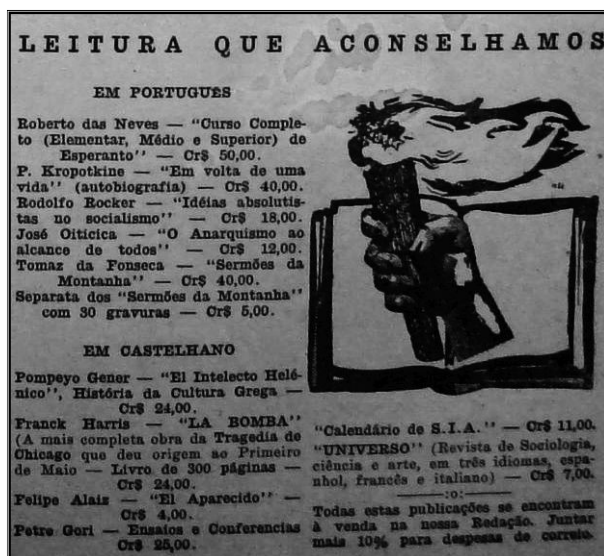
Leituras que Aconselhamos, Ação Direta (Rio de Janeiro, 26/5/1948)