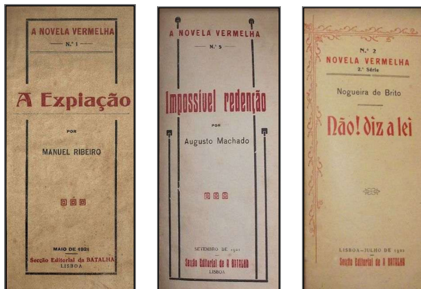
Capas de A Novela Vermelha , Lisboa, Secção Editorial de A Batalha (1921-1922)