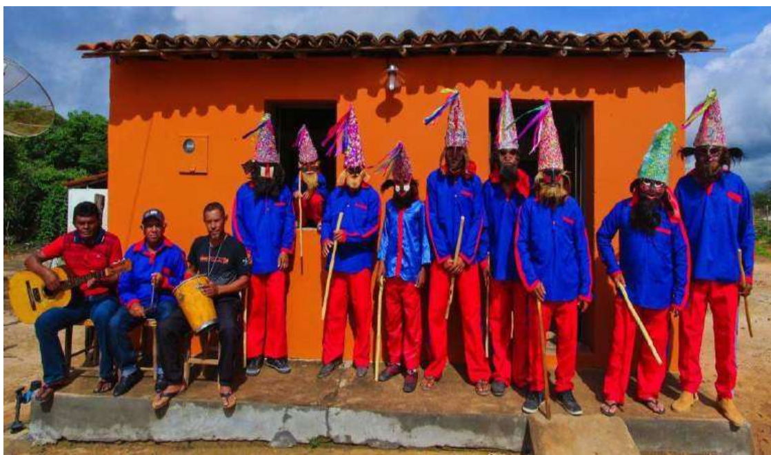
Imagem 3: Museu Casa do Mestre Antônio Luiz. Reisado de Máscaras