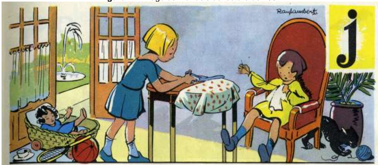
Figure 1 – Image de manuels de lecture de 1952

On voit ci-dessous l'exemple de deux manuels scolaires de lecture des années cinquante qui permettent d'identifier clairement ce programme caché d'éducation en acte.