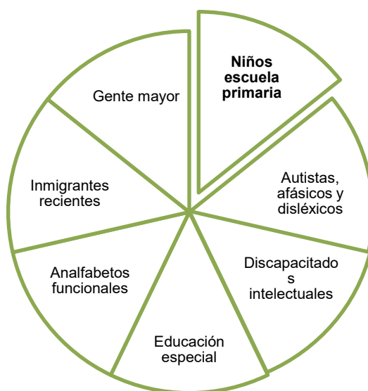
Figura 1 – Principales colectivos destinatarios de los materiales de LF

En España, el método de LF es relativamente nuevo. Desde el año 2002, la Asociación Lectura Fácil trabaja para hacer accesible la lectura, la cultura y la información a todas las personas, con especial atención a aquellas con dificultades lectoras y de comprensión – como pueden ser personas con alguna discapacidad intelectual, ancianos, población inmigrante reciente o alumnos de Educación Primaria, entre otros colectivos (Figura 1), “[...] mediante la aplicación de un conjunto de recomendaciones o pautas lingüísticas y ortotipográficas a las que deben atenerse los materiales creados al amparo de dicho concepto” (ANULA, 2005, p. 4).