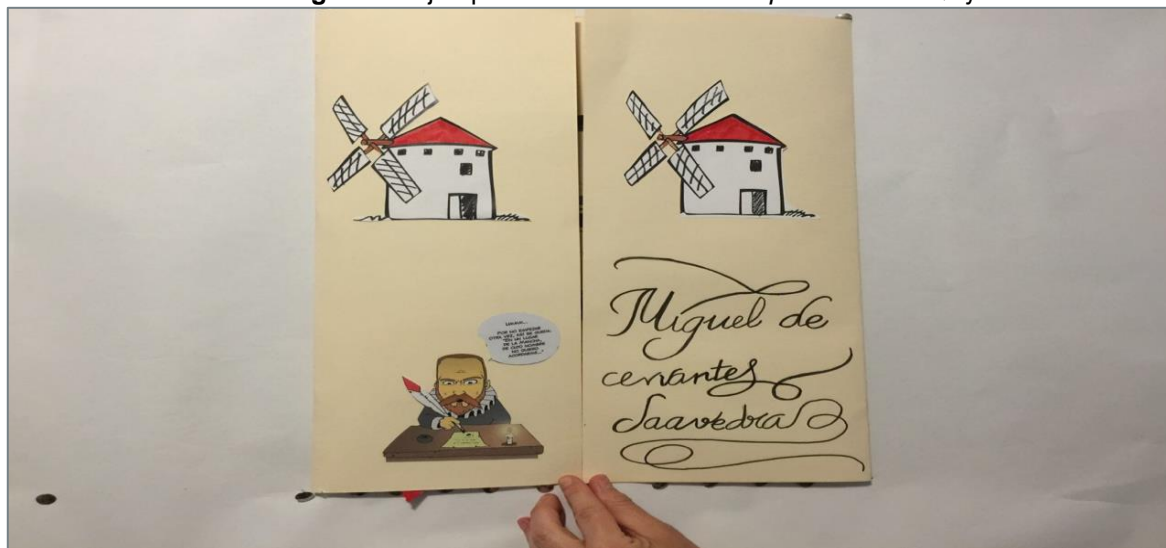
Imagen 1 – Ejemplo de libro artesanal: laap-book de El Quijote

6. Elaboración del dossier de síntesis. El dossier de síntesis supone la concreción de todo el trabajo anterior, es decir, el producto del proyecto. En esta experiencia, el dossier de síntesis ha tomado forma de dossier, libro artesanal o home-made book , realizados por los estudiantes, con una perspectiva integradora e interdisciplinar, como podemos observar en la Imagen 1.