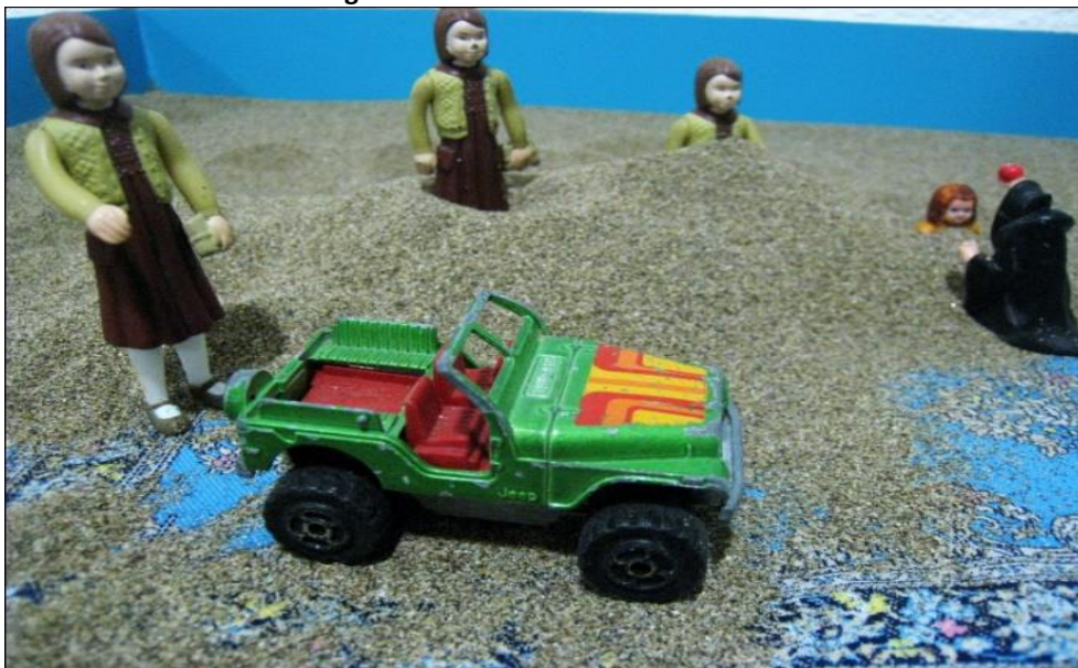
Figure 1 – 4 ème Jeu de sable d'Isabelle

à ses défenses: 4 jeux consécutifs vont présenter des productions idéalisées. Grebot, Coffinet & Laugier (2008) observent que l'idéalisation fait partie des défenses névrotiques des alcoolodépendants. Après cette phase, Isabelle va progressivement identifier des aspects clivés de sa personnalité et les associer à son vécu traumatique. Elle finira par se représenter sous la forme de 3 figurines identiques: "moi la jeune adolescente libre, moi l'amoureuse, et moi possédée par les démons: je ne l'aime pas celle-là. J'aimerais qu'elle meure" dit-elle. L'angoisse est massive: une sorte de crâne celtique est en arrière-plan. Je me risque: "Pourquoi est-elle un démon?"; "Je ne sais pas; parce qu'elle est en colère, elle est très en colère. ... je crois que c'est à cause de sa mère qui lui a dit qu'elle était laide et sale". Je propose: "Alors, elle serait triste?"; "Oui, peut-être que c'est ça en fait". Et là, Isabelle enchaîne à la première personne: "Ma mère me frappait parfois sur la tête avec ses chaussures à talon parce que je n'avais pas bien rangé ma chambre. Elle est morte ma mère, je n'ai pas envie de salir son image". Le dernier jeu de sable de Isabelle représente 4 figurines (Figure 1): 1 petite fille à qui une sorcière tend une pomme empoisonnée, et les 3 figurines identiques la représentant. Au lieu du démon, la 3 e figurine est en route dans une voiture, elle a trouvé une nouvelle manière d'avancer dans sa vie: "la psychothérapie" selon elle.