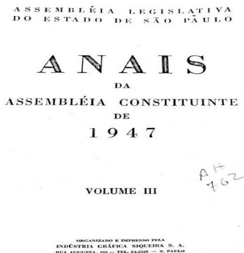
Figura 1 – Parte dos Anais da Assembleia Constituinte Paulista de 1947