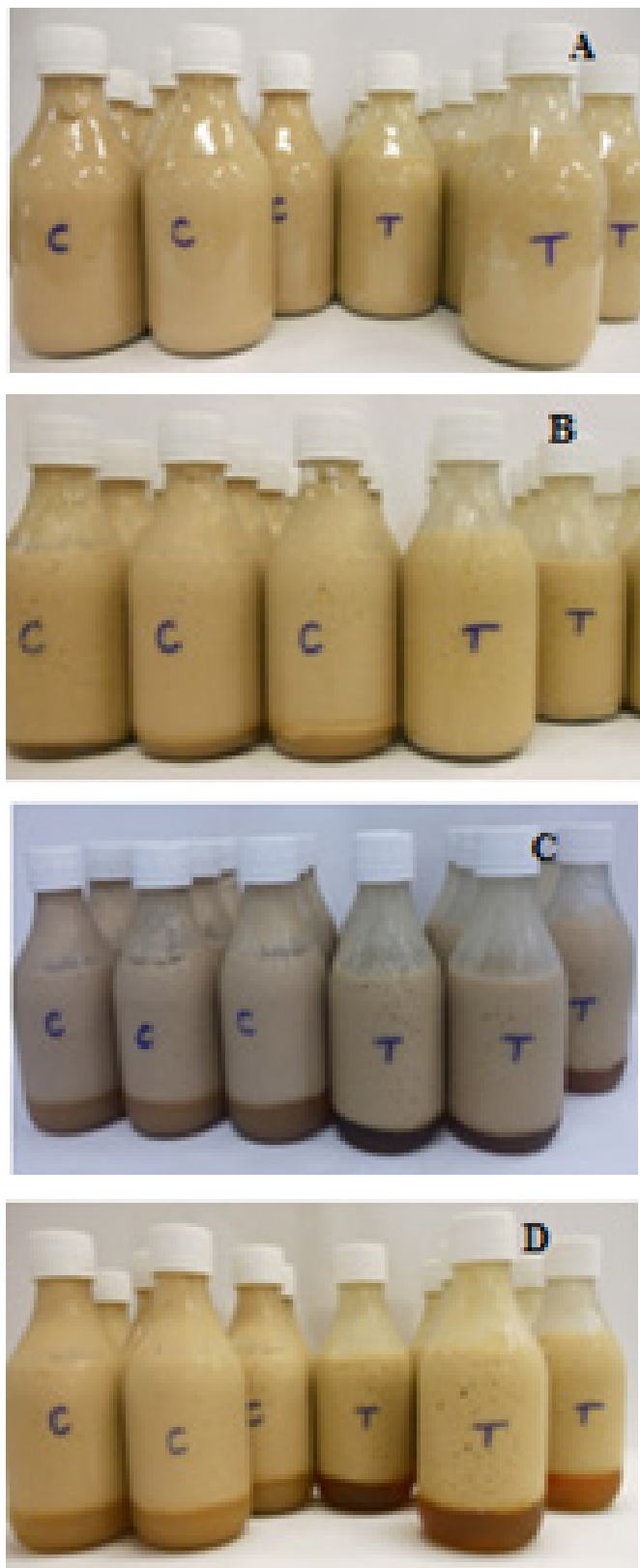
Figura 1: Amostras do suplemento C (controle) e T (tratamento) armazenadas a 3\pm 2 °C, sendo: A. Tempo zero. B. 7 dias. C. 14 dias. D. 14 dias.

um dia de armazenamento. Uma opção para maior vida-de-prateleira é o uso de embalagens não transparentes e a indicação de agitar o conteúdo antes de abrir.