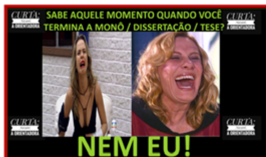
Figura 2 - Dêixis e sintagma pronominal