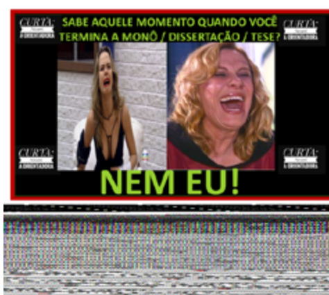
Figura 1 - Dêixis e sintagma adverbial

Fonte: Facebook/NazaréOrientadora. Acessado em: 10/11/2017.