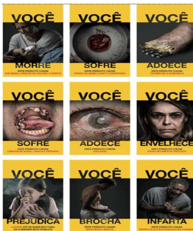
Figura 4 – Reprodução dos tipos de EA para produtos derivados do tabaco