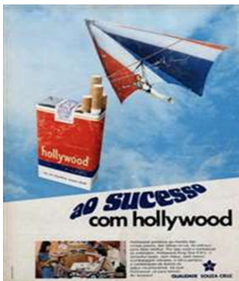
Figura 2 – “Ao sucesso com Hollywood”