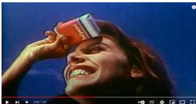
Figura 1 – Comercial de TV dos Cigarros Hollywood” 1985