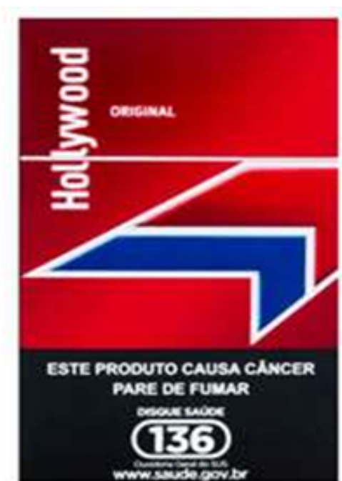
Figura 3 – Reprodução do rótulo de produto com a marca Hollywood