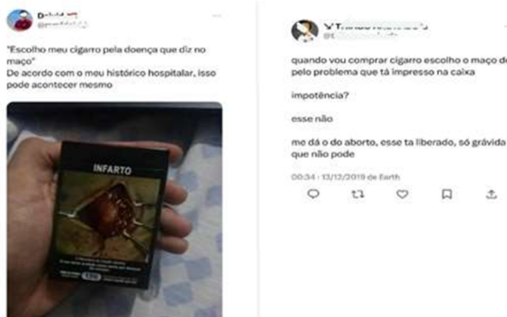
Figura 6 – Comentários em redes sociais C e D