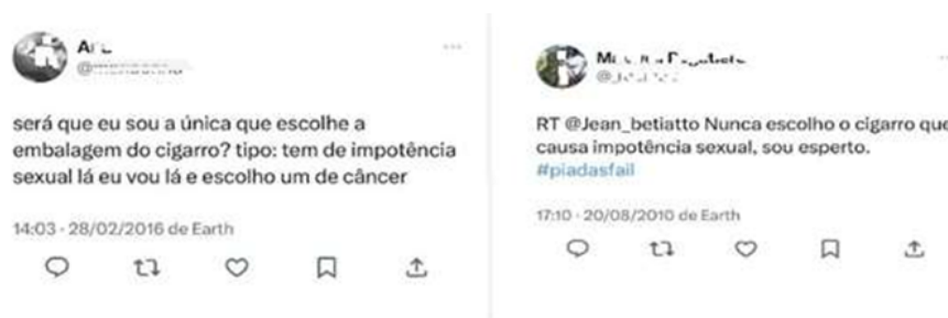
Figura 5 – Comentários em redes sociais A e B