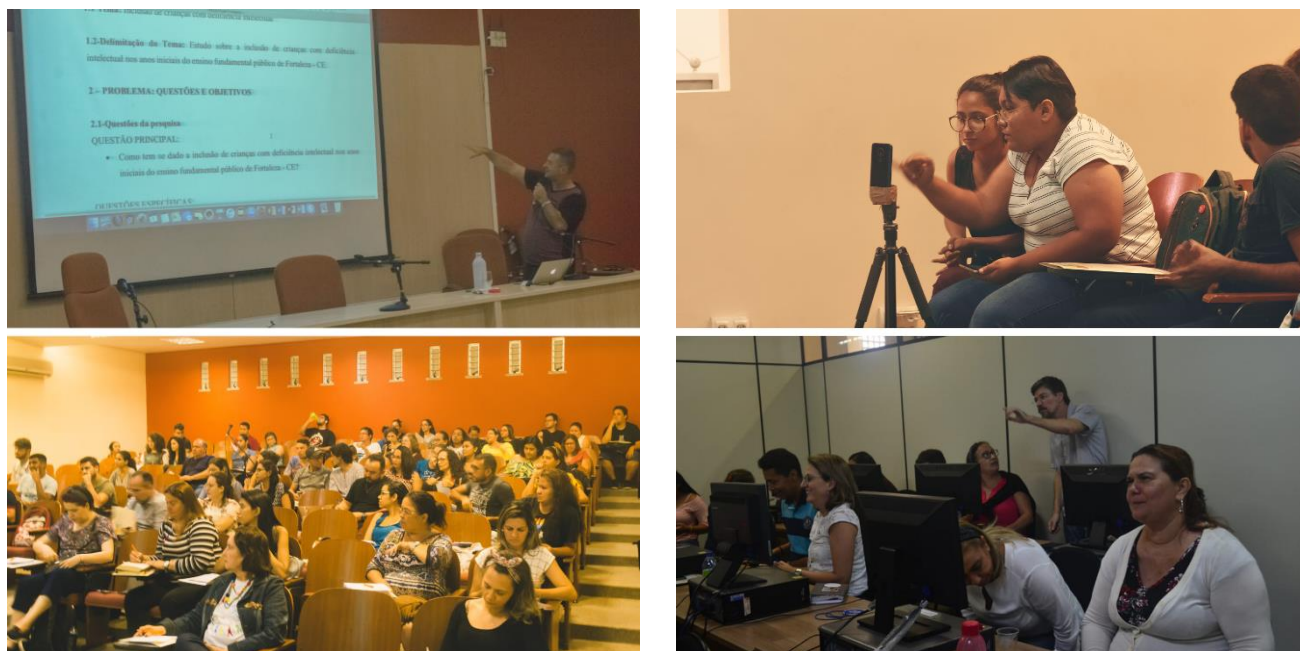
Imagem 4 – Registros da IV Semana de Metodologia & Produção Científica (SMPC 2019)