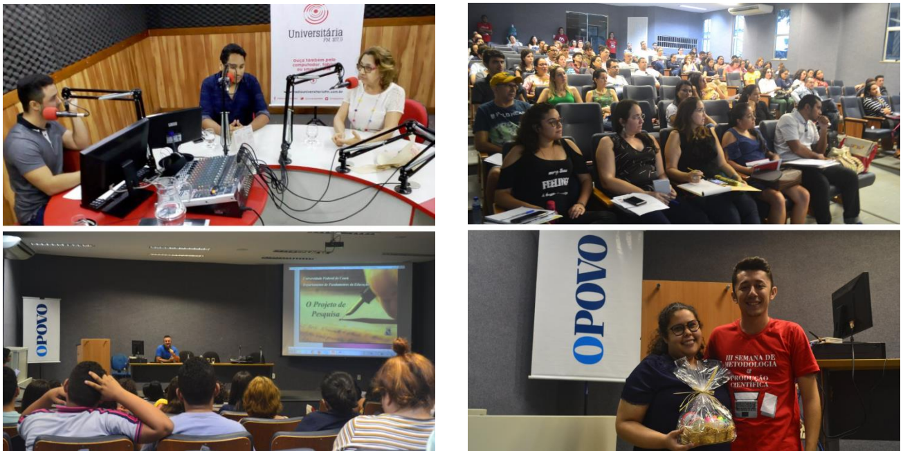
Imagem 3 – Registros da III Semana de Metodologia & Produção Científica (SMPC 2018)

registros de transmissão on-line , com o apoio da equipe do Instituto UFC Virtual (Santos, 2018). No ano seguinte, houve a consolidação da SMPC no calendário universitário da UFC, e as imagens a seguir retratam quatro momentos que merecem destaque na realização da terceira edição do evento: a participação de um dos representantes da comissão organizadora em programa da Rádio Universitária FM; as primeiras palestras ministradas em auditório do Centro de Humanidades da UFC; e o engajamento de bolsistas, estagiários e voluntários como representantes da comunidade discente na organização da SMPC e na mediação de sorteios e entrega de brindes.