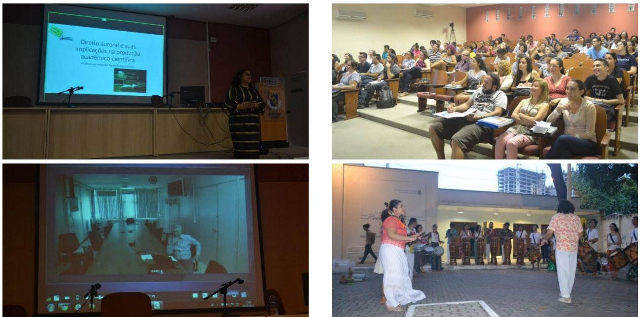
Imagem 2 – Registros da II Semana de Metodologia & Produção Científica (SMPC 2017)

Na imagem a seguir, ilustram-se quatro momentos da SMPC 2017, a saber: palestra de abertura da segunda edição, participação de palestrante diretamente de Brasília, auditório da Faculdade de Educação da UFC com um público estimado em 100 pessoas e uma apresentação cultural realizada no último dia do evento.