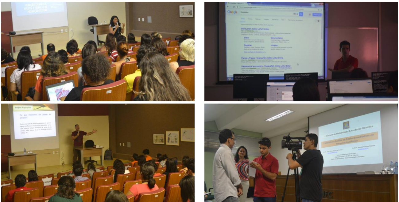
Imagem 1 – Registros da I Semana de Metodologia & Produção Científica (SMPC 2016)

A imagem a seguir apresenta quatro momentos importantes da SMPC 2016, quais sejam: duas palestras realizadas no primeiro dia de evento e que superaram a capacidade máxima de 90 pessoas no auditório da Biblioteca de Ciências Humanas da UFC; uma oficina ministrada no laboratório de informática da FEAAC; e a cobertura televisiva realizada pela equipe do programa UFCTV.