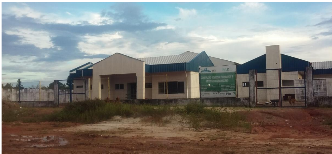
Figura 06: Obra da Creche “Tio Soró”

Macapá em face à seu iminente poder de organização e não obstante pelos interesses políticos ora presentes.