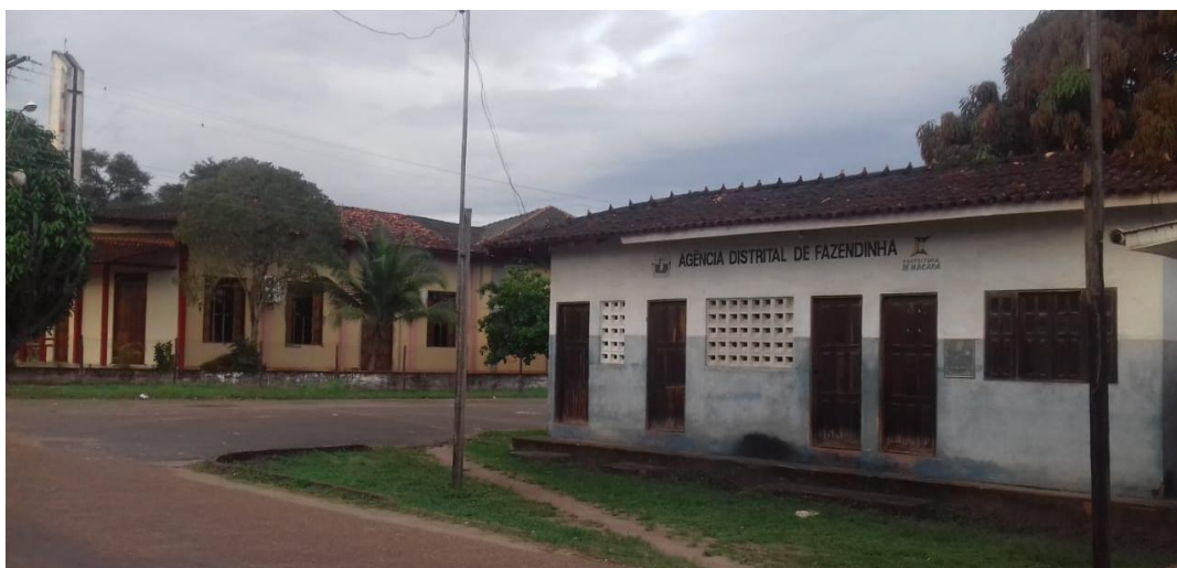
Figura 07: Agência Distrital de Fazendinha

Em relação à representatividade e atuação efetiva da Agência Distrital junto aos moradores do Distrito, esta mantém sua função social e se demonstra mais ou menos necessária em conformidade com o apoio que lhe é direcionado por parte do executivo municipal.