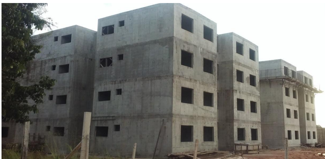
Figura 05: Construção do Residencial Janary Nunes

Mesmo com toda a expansão habitacional expressiva no Distrito de Fazendinha, observa-se novas investidas de políticas públicas na área de habitação quando o governo municipal trouxe para o Distrito a construção de uma unidade residencial, com 500 apartamentos (Conjunto habitacional Janary Nunes), que tem por objetivo suprir o déficit habitacional do Distrito e realocar famílias residentes em áreas impróprias, área de risco ou coabitação involuntária.