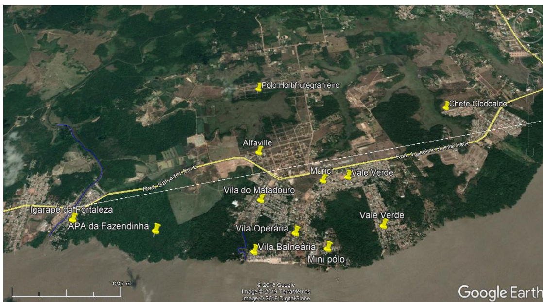
Figura 02 - Recorte espacial do Distrito de Fazendinha

delineando o aspecto cada vez mais urbano do respectivo distrito. A pressão sobre algumas áreas nativas é bem aparente e estas resistem em sua maioria por conta de certa restrição ao acesso como a APA da Fazendinha, área da Marinha com forte pressão dos bairros Murici e Vale Verde e área do Parque Zoobotânico e IEPA às proximidades do Bairro Chefe Clodoaldo.