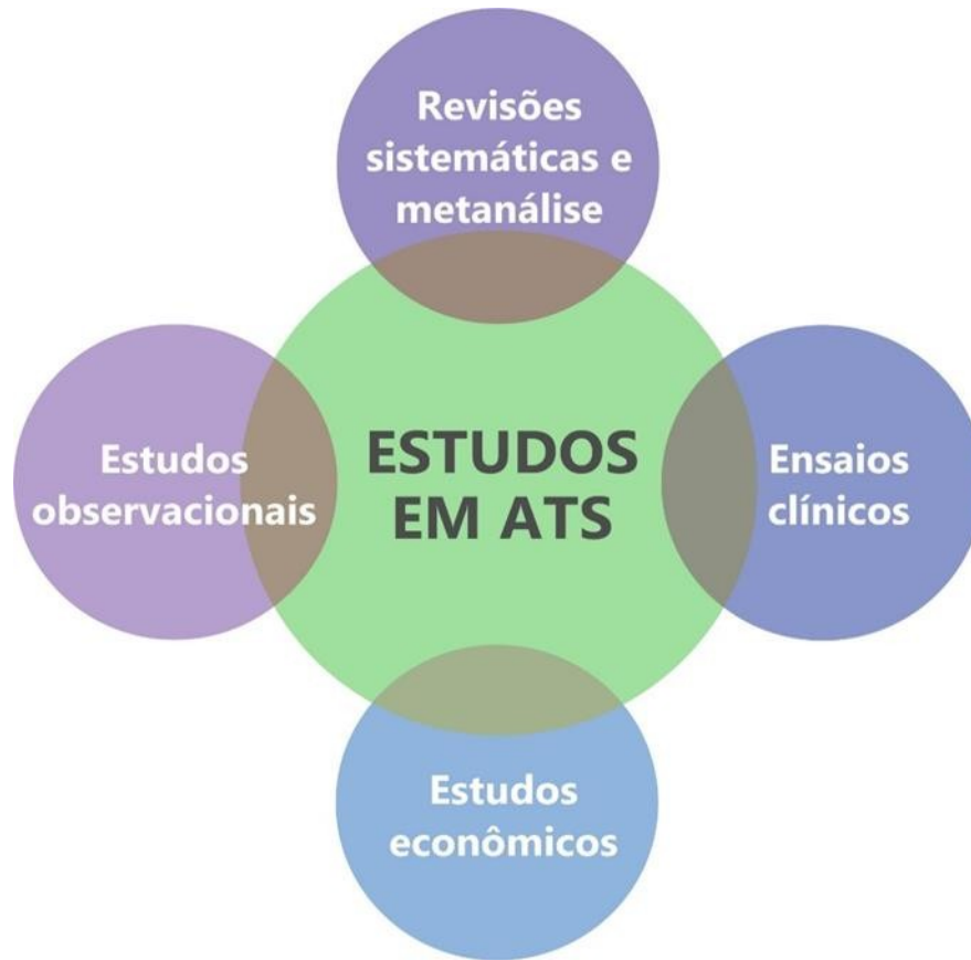
Figura 2 – Estudos em ATS.