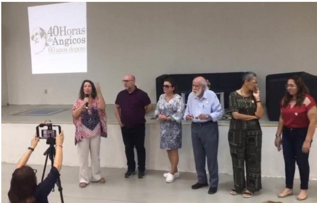
Imagen 5 - Diálogo Cine Foro 5/4/2023.

También despertó la curiosidad de ellos, es decir, los ex alumnos querían saber de nosotras, querían conocer nuestras impresiones sobre la ciudad de Angicos, sus habitantes, su historia, cómo eran conocidos fuera de Brasil, por qué nos interesaba el tema etc. De manera general, reflexionaban sobre por qué la obra de Paulo Freire es apreciada en el exterior, pero, es fuertemente criticada en su propio país. Sin duda, los nuevos y viejos habitantes de Angicos se sienten orgullosos del papel en la historia de la educación, que tiene esta ciudad en la cual, en 1993, Paulo Freire expresó sentirse “más conmovido” que en ningún otro lugar del mundo (FREIRE, 1993). Para un hombre que recorrió el mundo, esto no es decir poca cosa.