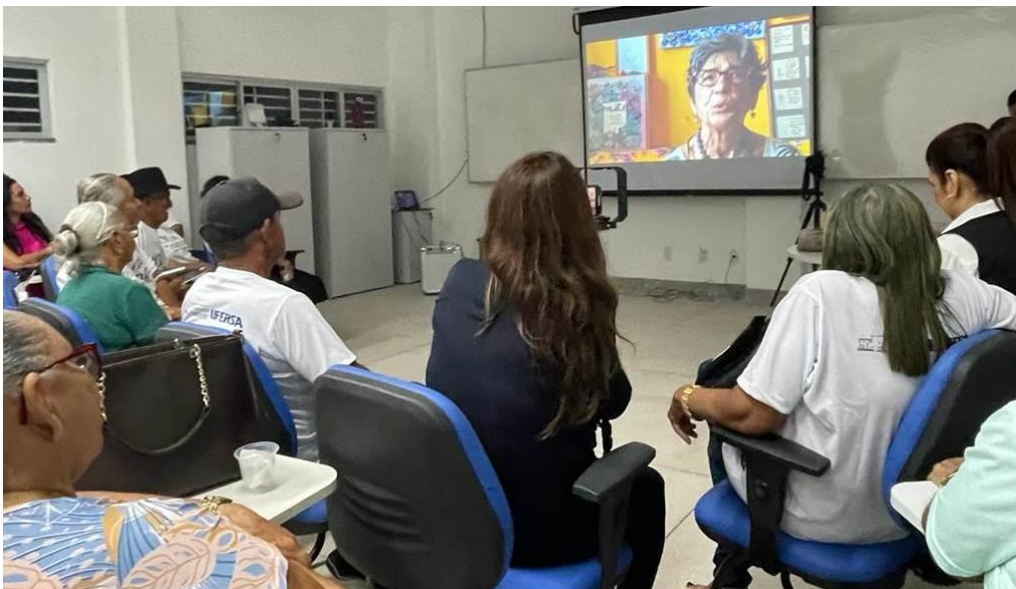
Imagen 4 - Proyección de “Alfabeto de Libertad” 5/4/2023

En la proyección de la noche, nuestra alegría fue completa al tener una oportunidad única de presenciar la reacción de algunos de los ex alumnos de esas primeras 40 horas que estuvieron juntos en el Memorial Paulo Freire de la UFERSA.