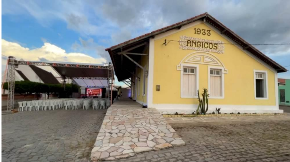
Imagen 1 - Casa de la Cultura Angicos/RN, 4 de abril de 2023

hoy de 68 y en la época con 8 años de edad, quien, contando con mejor estado de salud, sí pudo estar - en vivo y en directo - en un nuevo aniversario de aquella epopeya.