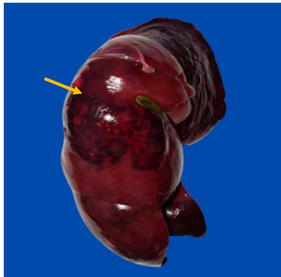
Figura 02: Hepatomegalia, área necrosada (seta), focalmente extensivas, predominando em lobos mediais.

No fígado uma evidente hepatomegalia, áreas necrosadas, focalmente extensivas, predominando em lobos mediais (Fig. 02). Mesentério apresentava moderada congestão e presença de petequeias. No prepúcio notava-se leve presença de secreção supurativa.