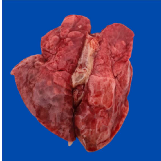
Figura 01: Pulmões não colabados, superfície brilhante e pontos de hemorragia.

Prosseguindo para a análise interna, observou-se pulmões não colabados, superfície brilhante e pontos de hemorragia (Fig. 01). Ao corte, foi possível notar a presença de líquido serosanguinolento espumoso.