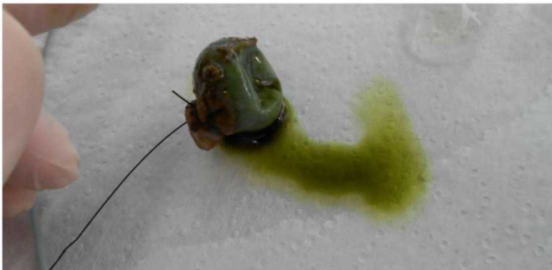
Figura 2: Vesícula biliar removida de um cão com colecistite necrosante.

morfina (1mg/kg/SC/BID), dipirona (25mg/kg/IV/BID) e fluidoterapia com solução fisiológica (250 mL/24 horas), até o momento da alta, a qual ocorreu quatro dias após o procedimento cirúrgico.