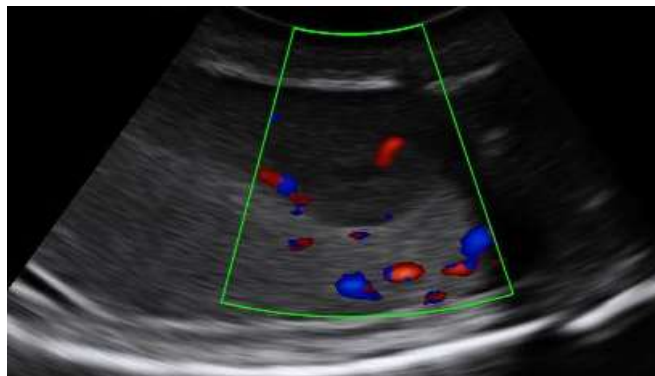
Figura 02: Imagem ultrassonográfica de testículo direito evidenciando vascularização anormal ao redor de área hipocogênica em testículo esquerdo.

Foi feita avaliação pelo modo Doppler colorido, visibilizando-se evidente vascularização marginal e interna dos nódulos, indicando possível neoformação, como demonstrado na Fig. 02. Adicionalmente, a presença de discreta quantidade de líquido entre testículo e a túnica vaginal também foi relatada bilateralmente, sendo indicativo de hidrocele bilateral.