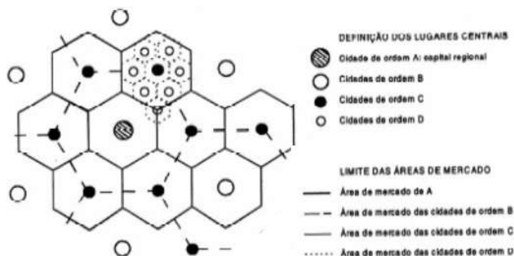
Figura 03 – Os lugares centrais – modelo de Walter Christaller