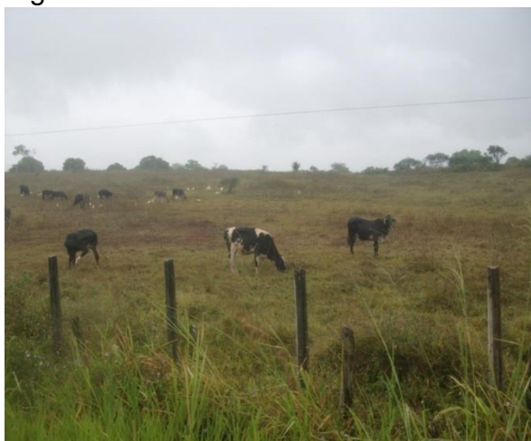
Figura 6: Pecuária Leiteira

A produção leiteira sofre alterações a partir de mudanças climáticas que decaem ou aumentam a quantidade de leite produzido, principalmente quando enfrentam períodos de estiagem, isso se apresenta como algo comum na Região Nordeste brasileira pela sua posição geográfica, essa situação passa a ser enfrentada com alimentação do rebanho pela palma forrageira, muito usada na região desde que foi introduzida no semiárido nordestino por Delmiro Gouveia no início do século XX e passou a ser plantado como alternativa de alimento.