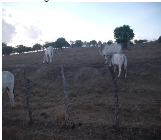
Figura 7: Pecuária de Corte