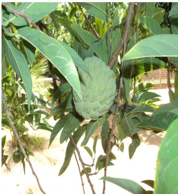
Figura 4: Fruta do Conde

A produção de fruticultura se destaca como uma potencialidade local, como citado acima, no qual, o aumento da diversidade de sua produção está ganhando espaço, possibilitando a geração de renda não somente aos pequenos mais também aos médios produtores pelo qual o município em questão vem desenvolvendo a atividade.