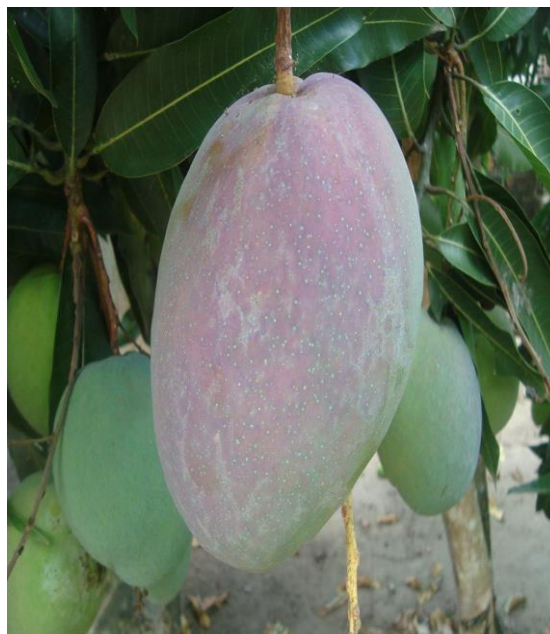
Figura 5: Manga