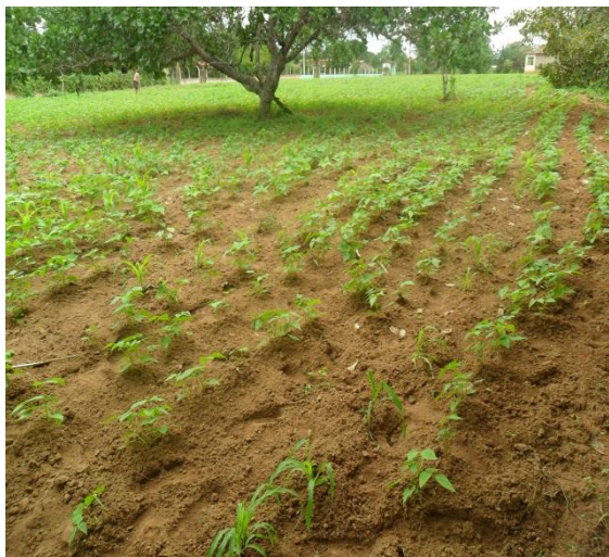
Figura 3. Cultivo de abóbora