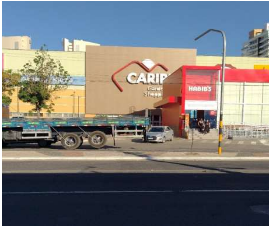
Figura 2 – Cariri Garden Shopping

Mediante a isso, acredita-se neste trabalho que já havia uma centralidade em formação no bairro Triângulo, contanto, após a instalação do Cariri Garden Shopping (Figura 2), em 1997, houve uma acentuação no fluxo comercial da localidade, onde o trecho em que se fixou se consolidou como um dos principais corredores urbanos da cidade.