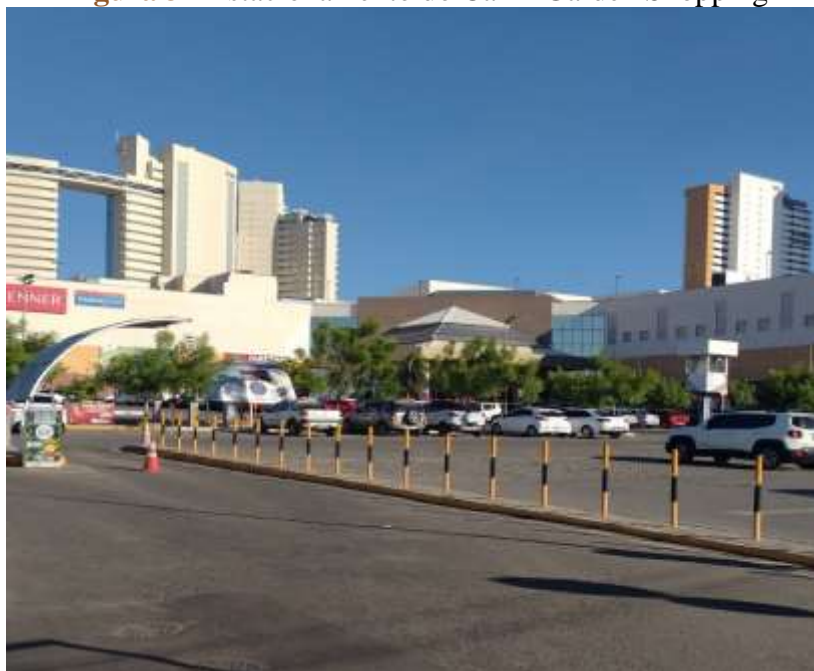
Figura 3 - Estacionamento do Cariri Garden Shopping

Assim, uma das novidades nessa reforma se dá ainda no tocante ao estacionamento do Cariri Garden Shopping (Figura 3), pois, além de ter sido ampliado, passou a receber eventos no local, como shows de música. Com isso, esse shopping adveio a possuir mais uma utilidade para a cidade.