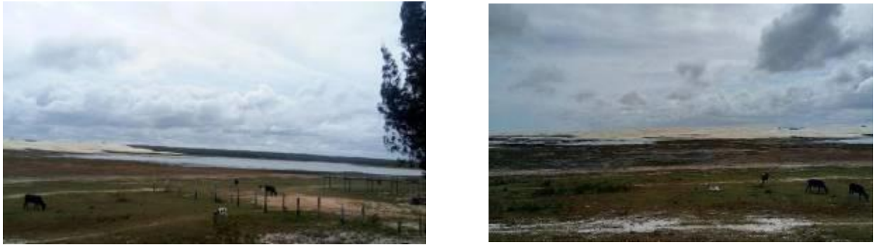
Figura2 e 3: Lagoa do rio Portinho em Parnaíba – PI.

Segundo Mesquita (2016), observa-se também que partes dos corpos hídricos que banham a lagoa do portinho encontram-se inseridos sobre bases geológicas formadas pelos depósitos litorâneos, destacando-se em alguns trechos a ocorrência de depósitos de pântanos e de mangues.