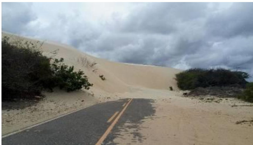
Figura 4: Corpos de dunas móveis sobre via de acesso da lagoa do portinho-PI. Fonte: Autoras (2017).

Os fluxos eólicos se caracterizam pelo transporte constante de sedimentos que originaram os grandes campos de dunas, de acordo com Paula (2013) os depósitos eólicos presentes na planície costeira do Piauí são da terceira geração, caracterizados pela ausência de vegetação. É importante ressaltar que esses depósitos seguem apenas seu fluxo de dinâmica natural, hoje as migrações desses sedimentos trazidos pela abrasão eólica encontram-se recobrindo as vias de acesso antes implantadas pelo homem impossibilitando o acesso a lagoa.