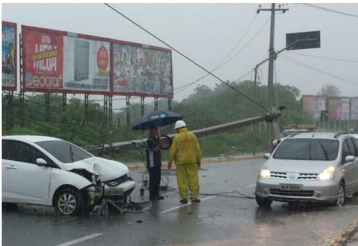
Figura 05: Acidente ocasionado pela chuva no entorno do Shopping.

Na imagem a cima é possível observar o caos em que se encontra os motoristas ocorreu por causa da falta de escoamento da água pelos bueiros entupidos . Segundo os moradores, o aterramento de diversas lagoas da região para a construção de estabelecimentos comerciais, aliado a problemas estruturais da via, foram a causa do problema. Já figura 05, a colisão de um carro que derrubou um poste foi causada pela forte chuva na época, formando um congestionamento na CE-040 nas proximidades do Shopping Eusébio Open Mall, comprometendo a energia elétrica do Centro das Tapioqueiras .