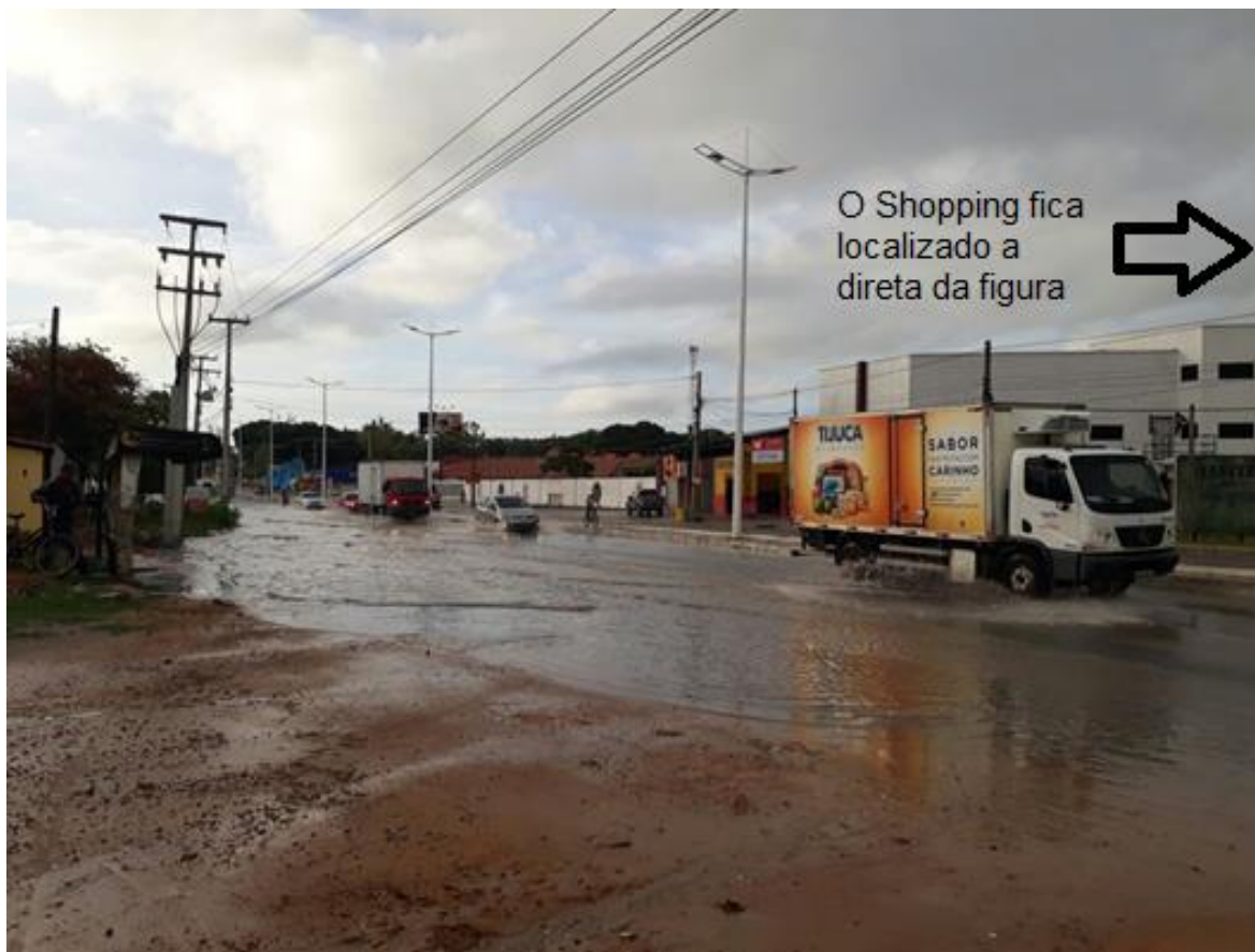
Figura 06: Trecho da CE-040 alagada do entorno do Shopping.

Tudo isso por causas do aterramento da lagoa e como consequência o escoamento da água da chuva para as áreas mais próximas, ou seja, as casas desses moradores, ressaltando a evidente falta de planejamento e ação enérgica do poder público. Isso ocorre porque mesmo com intervenções estruturais com a finalidade de artificializar a natureza, simulando sua dinâmica, que por sua vez sempre vai se adaptar e demonstrar sua força.