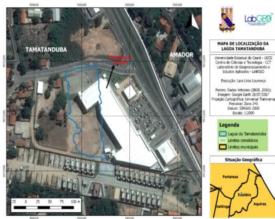
Figura 01. Mapa de localização da lagoa da Tamatanduba.

O município de Eusébio está localizado a Nordeste do estado do Ceará, tem como municípios vizinhos ao norte: Fortaleza; ao sul e a leste: Aquiraz; e a oeste: Fortaleza e Itaitinga. Possui uma área total de 79 km 2 e a distância até a capital é de 18 km, segundo os dados obtidos no Perfil Básico Municipal do IPECE (2017).