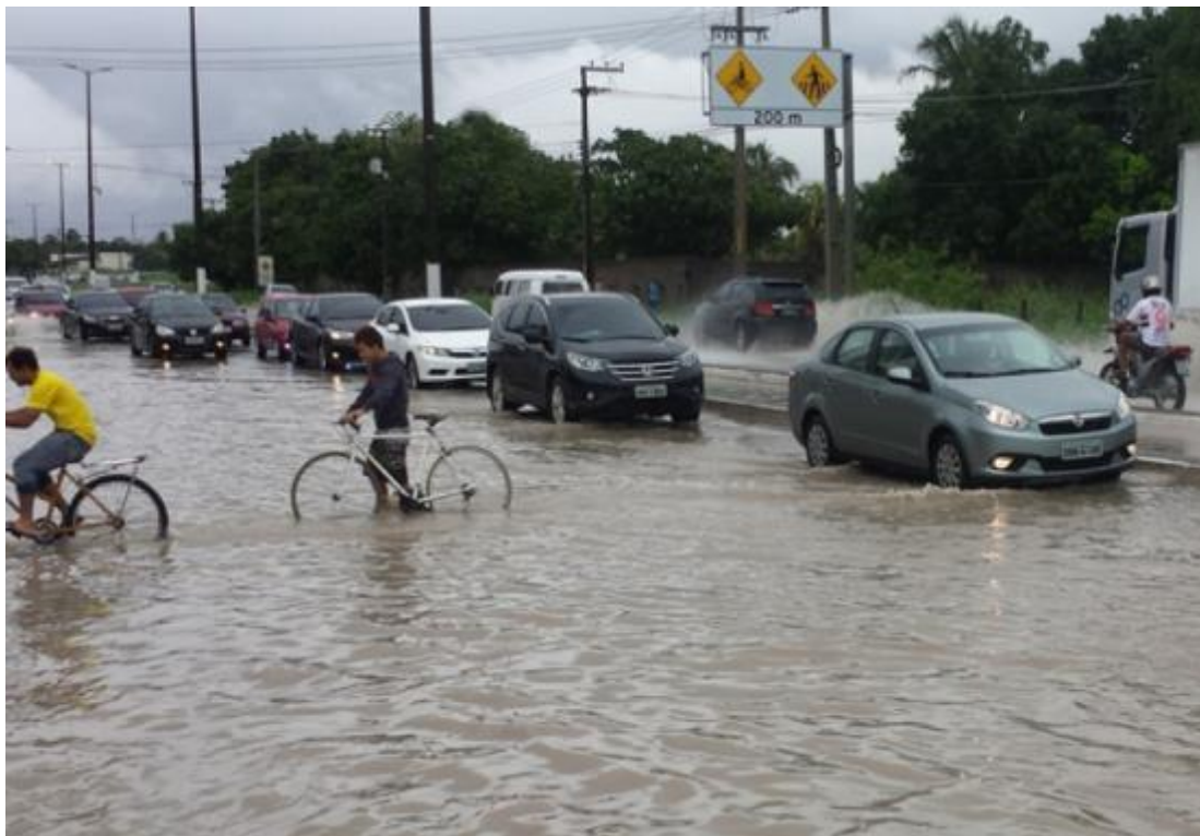
Figura 04: Trecho da CE-040 alagada, próximo ao Shopping.

A primeira consequência a ser destacada é a falta de uma drenagem e saneamento básico devidamente corretos, pois, em épocas chuvosas o shopping e a área que circunda ficam alagados por causa do curso d'água da lagoa que existia ali, ocasionando congestionamentos na CE-040 prejudicando o fluxo dos carros por causa da grande quantidade de água acumulada, como observado na Figura 04, 05 e 06, afetando também os moradores da área do entorno do Shopping.