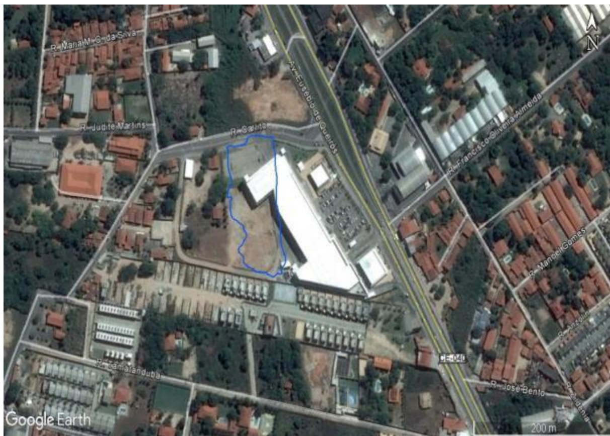
Figura 03. Área aterrada com a construção do Shopping Center em 2017.

Observa-se que em um empreendimento dessa magnitude, conduzindo a uma concentração de interesses nas mais diversas áreas do Shopping, pois após a construção do mesmo toda a região do entorno teve seus terrenos valorizados, levando a construção de mais casas e condomínios com alto padrão construtivo, causando um adensamento populacional.