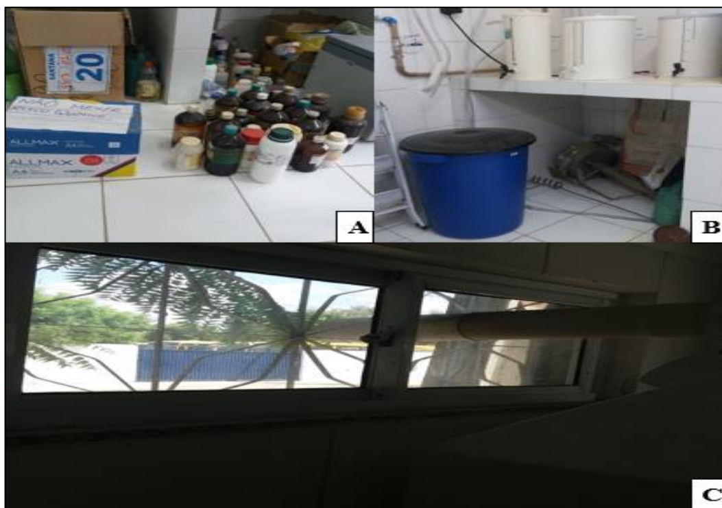
Figura 2 – Consequências da falta de gerenciamento de resíduos laboratoriais A- Resíduos sem identificação B- Armazenamento inadequado da água destilada e C- Dispersão de gases inadequados.

A figura 2A representa a consequência das ações cotidianas de professores e alunos, após a finalização de suas pesquisas, que acabam por deixar resíduos químicos dentro do laboratório que muitas vezes só aumentam durante o tempo. E os reagentes e substâncias usados misturados sem saber qual sua identificação, pois nem todos os frascos possuem identificação, além de causar danos organizacionais, podem ocorrer acidentes com esses produtos como liberação de vapores tóxicos além do risco de acidentes devido a incompatibilidade dos reagentes.