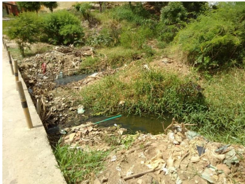
Figura 04. Ponte inacabada da Rua Antônio Tomé, com entulhos no Rio Canindé.

O que também chama bastante atenção são os amontados de materiais de construção, próximos de empreendimentos privados e públicos, que pode-se ver também dentro do rio, apontados visualmente na Figura 04.