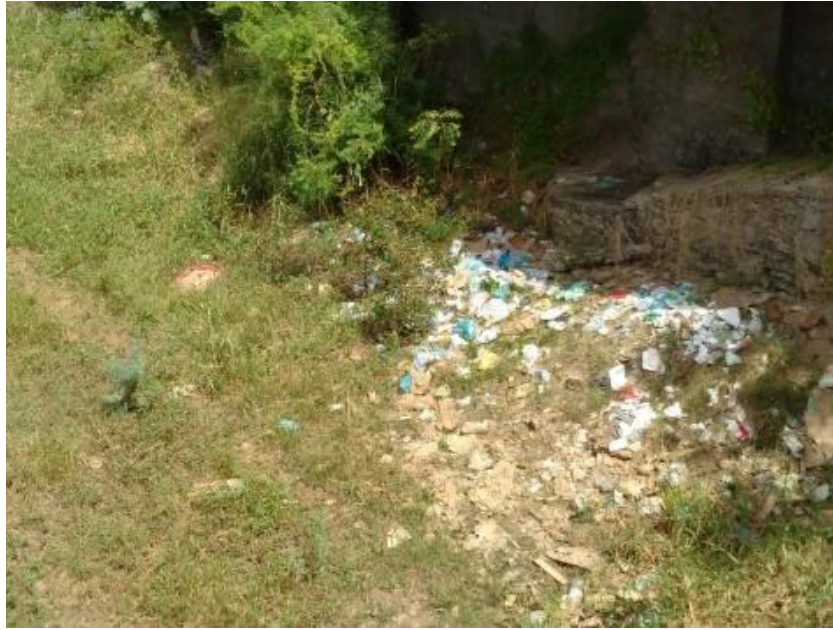
Figura 03. Acúmulo de lixo na margem do Rio Canindé.

O que também chama bastante atenção são os amontados de materiais de construção, próximos de empreendimentos privados e públicos, que pode-se ver também dentro do rio, apontados visualmente na Figura 04.