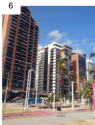
Figura 6 - Prédios que Compõem a Silhueta da Beira Mar

Essa ação se deu principalmente por dois agentes, os Promotores Imobiliários e o Estado, o Estado atuou na implantação de políticas públicas direcionadas para o turismo, o Programa de Desenvolvimento do Turismo no Nordeste (PRODETUR) por exemplo, que teve o foco de ampliar a infraestrutura da região do nordeste focado para o turismo. Já os Promotores Imobiliários atuaram na construção da silhueta que hoje vemos ao longo da Beira-Mar, desenvolvimento a grande dinâmica imobiliária que acontece atualmente, onde temos a compra de prédios tradicionais e a transformação dos mesmos em prédios altos, imponentes, trazendo a exclusividade a quem pode comprá-los, a compra da paisagem (Figura 6).