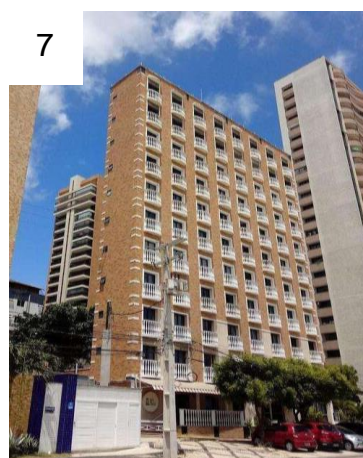
Figura 7 - Hotel Clássico Flat

O Hotel Flat Classic (Figura 7), é um Apart-Hotel localizado em frente ao mar da Praia de Iracema no bairro de Meireles ( onde se tem um dos metros quadrados mais caros de Fortaleza), ele se torna um grande atrativo de hospedagem por ser localizado em frente ao aterro da Praia de Iracema, além de se tornar um atrativo pela sua proporção, ele apresenta uma altura bastante relevante e sua largura se torna mais estreita que os demais ao seu redor.