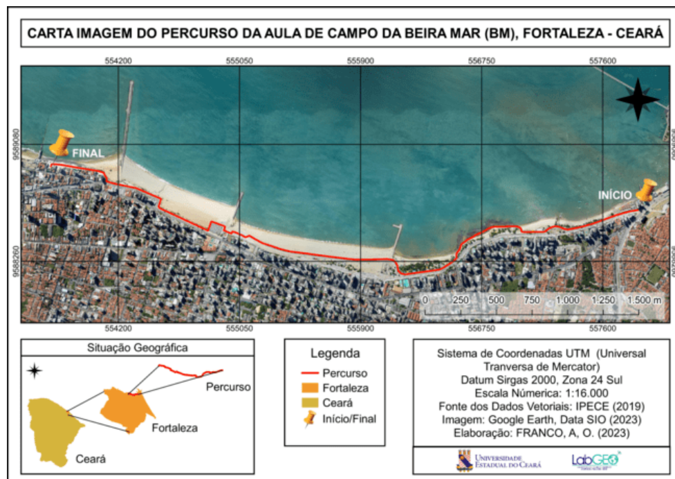
Figura 1 – Carta Imagem do Percurso do Campo

Foi utilizado a representação do tipo carta imagem, que segundo o Instituto Brasileiro de Geografia e Estatística (IBGE) são representações cartográficas usando mosaicos de fotografias aéreas ou imagens de satélites ortorretificadas como a que foi utilizada no artigo em questão, para a identificação visual do percurso (Figura 1), se utilizou o software livre QGIS 3.22.10, na elaboração da carta imagem foi realizado o processo de georreferenciamento da imagem do Google Earth, sendo utilizado a escala de representação 1:16.000.