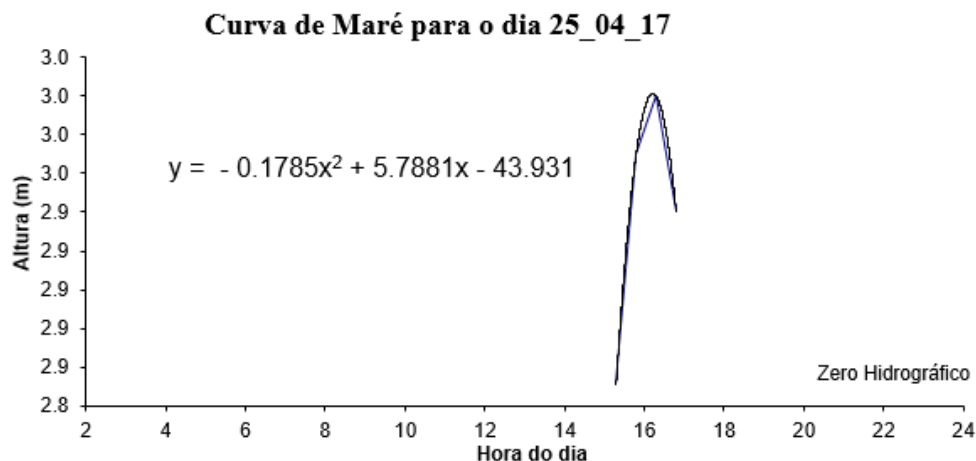
Figura 04. Equação da curva de Maré.

Foram definidas pela National Marine Electronics Association (NMEA) especificações que determinam a interface entre equipamentos marinhos, permitindo assim que eletrônicos marinhos possam enviar informações para computadores e outros equipamentos marítimos.