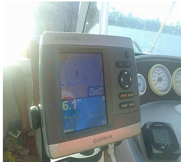
Figura 02. GPS.

Além disso também foi realizada a medição da maré no horário em que a aquisição dos dados foi realizada. A medição foi feita utilizando uma régua instalada no Pier da Boca da Barra (Figura 03), com aferições feitas em intervalos de 5 minutos. Esses dados posteriormente foram utilizados para gerar o gráfico da curva de maré e para que as correções pertinentes aos dados de campo fossem feitas.