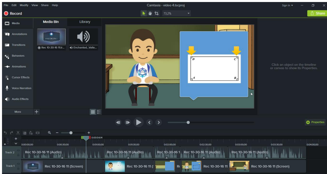
Figura 3 – Gravação das imagens no Camtasia Studio