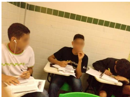
Figura 2 - Estudantes respondendo o caça-palavras

Esta atividade contribuiu de forma dinâmica para que os participantes identificassem as palavras que foram discutidas no decorrer da história da Torre de Hanói.