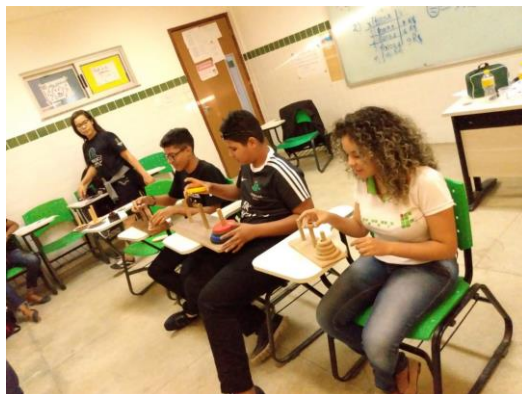
Figura 3 - Campeonato de Torres de Hanói

Por fim, no último momento, ocorreu um campeonato com as Torres de Hanói. Ficou evidente a preocupação que os estudantes tinham para utilizar a quantidade mínima de movimentos. Conforme mostra a figura a seguir.