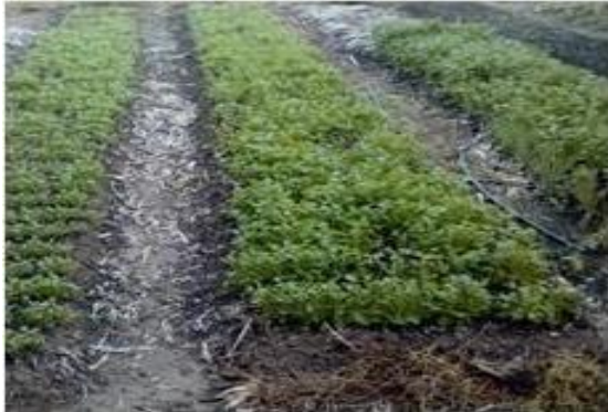
Figura 1 – Canteiro de coentro.

O sistema de cultivo que mais tem sido empregado é o Nutrient Film Technique (NFT), em que as duas culturas são cultivadas separadamente, ou seja, em cultivo solteiro para posterior formação de maços mistos (LUZ et al. , 2012).