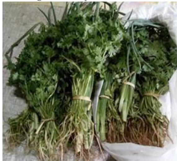
Figura 6 – Maços de cheiro verde

Pode-se observar abaixo as imagens que mostram o que são os maços de cheiro verde: