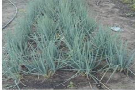
Figura 2 – Canteiro de cebolinha.