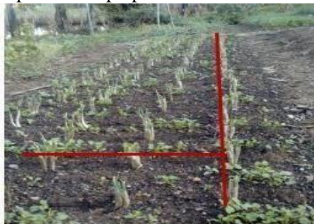
Figura 3 – Linhas paralelas e perpendiculares nos canteiros de cebolinha.

Com isso, notam-se diferentes relações matemáticas existentes nessa fase do cultivo de cheiro verde, conforme ilustrações abaixo: